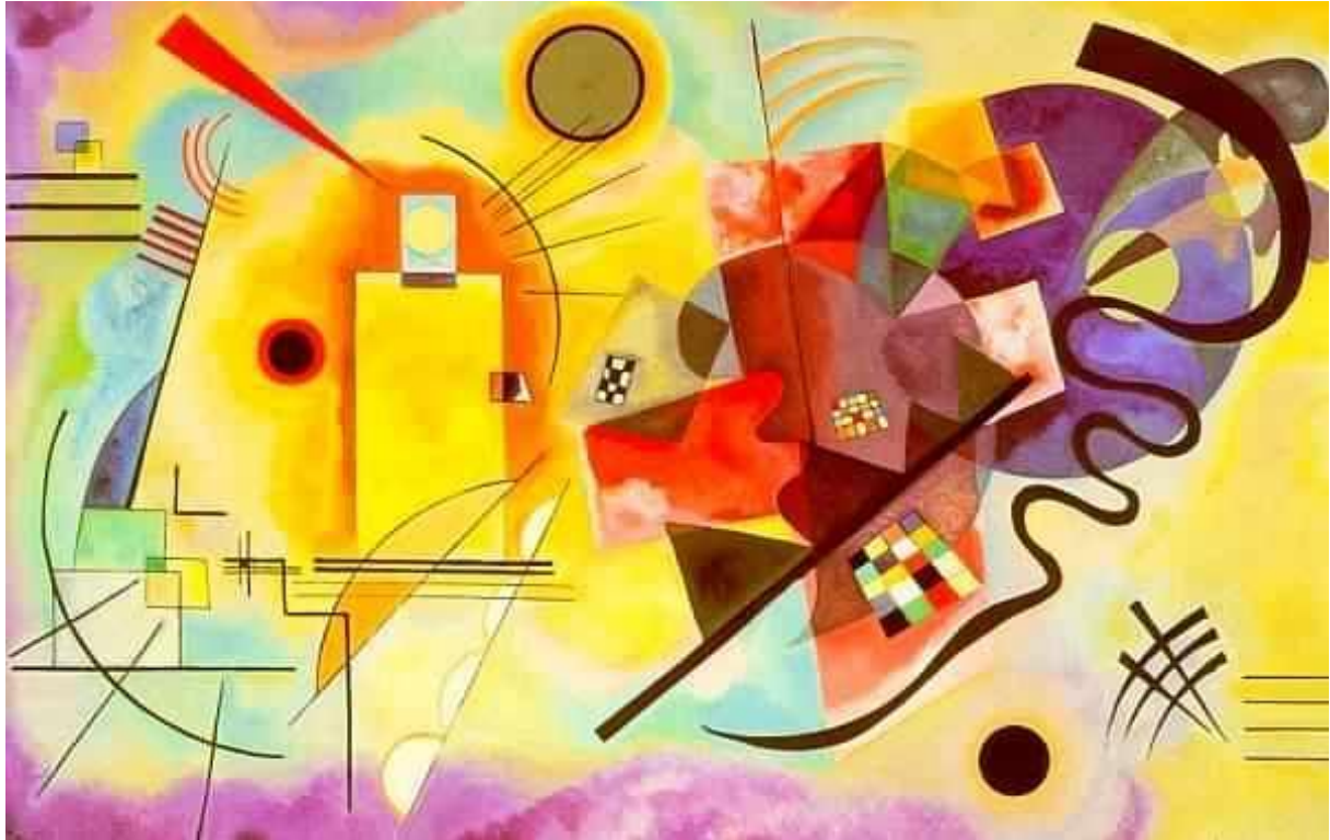
Jaune - Rouge - Bleu - Wassily Kandinsky (1866 - 1944). Droits réservés.