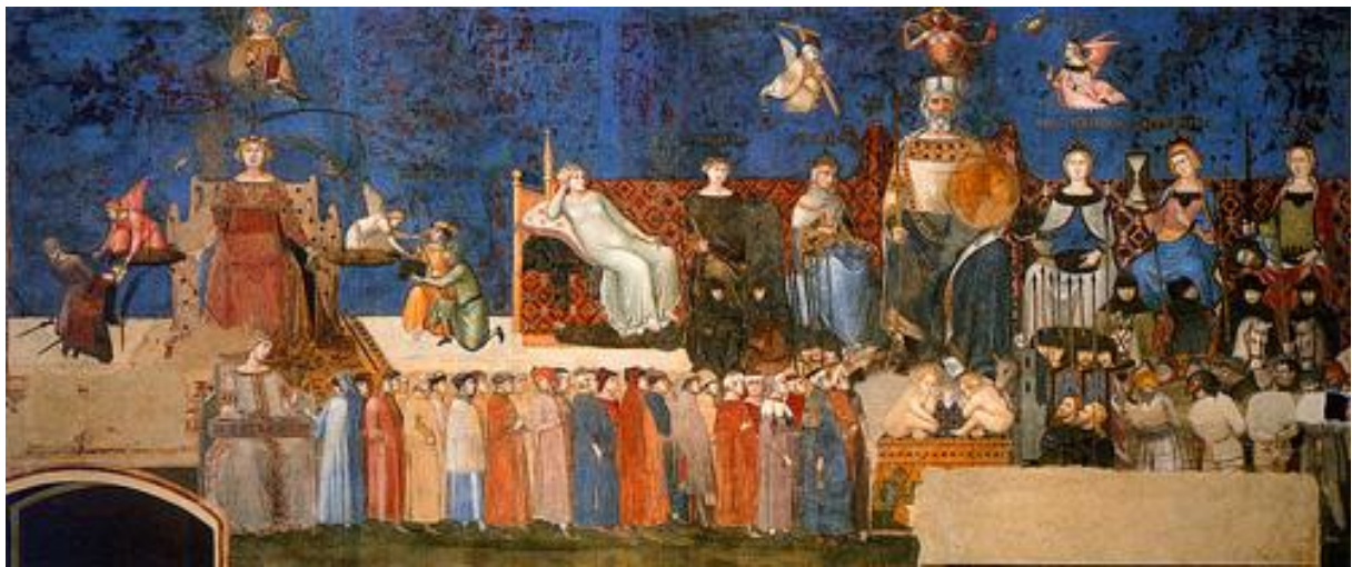
Allégorie du Bon Gouvernement, Ambrogio Lorenzetti, 1337-1340 (Palazzo Pubblico, Sienne).